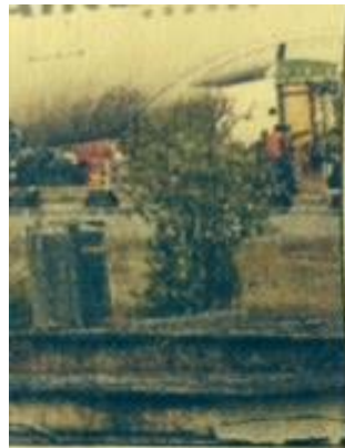
...landing in dense fog crew members in the possible for the