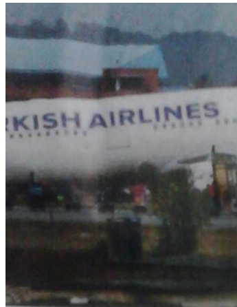
runway while landing in dense fog angers and 11 crew members in the are likely responsible for the